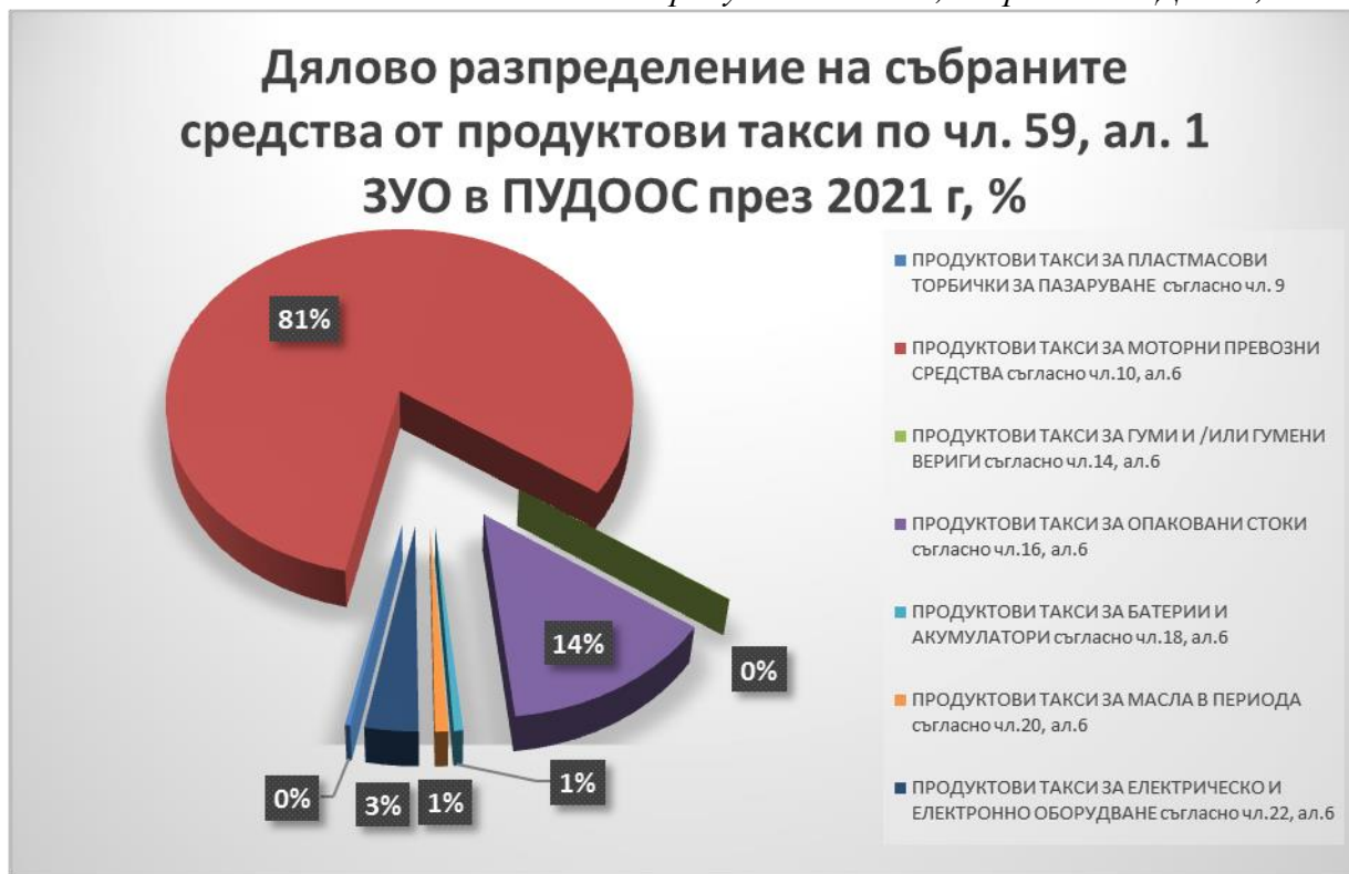
Фиг. 1. Продуктови такси, събрани в ПУДООС, 2021 г.

*Полетата със стойност "0" отразяват дялово разпределение по-малко от 1%